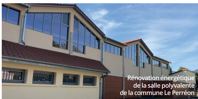
Rénovation énergétique de la salle polyvalente de la commune Le Perréon