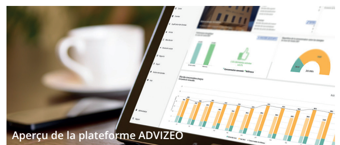
Aperçu de la plateforme ADVIZEO

Réduire les dépenses énergétiques de sa collectivité, répondre aux enjeux du décret tertiaire, optimiser les consommations de ses bâtiments et agir pour améliorer l'empreinte environnementale de son patrimoine sont autant de raisons pour entamer une démarche de suivi et d'optimisation des consommations énergétiques sur son territoire.