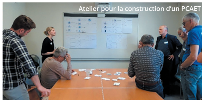
Atelier pour la construction d'un PCAET