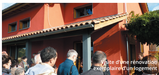
Visite d'une rénovation exemplaire d'un logement

L'ALTE 69 vous propose également des sessions d'information et des formations dédiées pour comprendre les enjeux liés à la transition énergétique , ou pour faire le point sur des aspects purement techniques , comme par exemple le suivi et l'exploitation des chaufferies biomasses de petite puissance ou encore l'application des exigences du décret tertiaire.